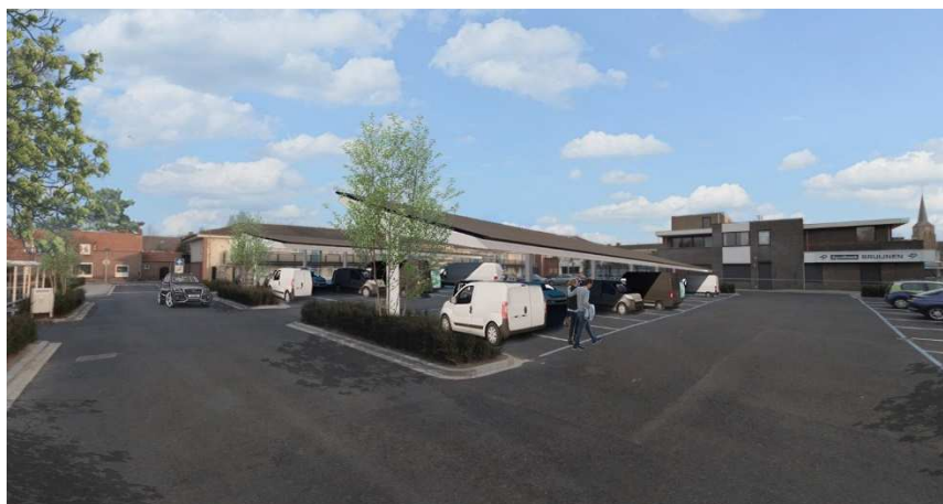
Figuur 2 Impressie van zonnecarports (variant met reguliere zonnepanelen zoals opgenomen in het haalbaarheidsonderzoek) boven het parkeerterrein (Bureau Kragten 2020)

Financieel levert de business case over 25 jaar nog geen positief resultaat. Mogelijk gebeurt dit wel door het plaatsen van laadpalen of een scherpe prijs in de aanbesteding. Dit heeft er onder meer mee te maken dat is gerekend met glas-glas panelen. Het voordeel van glas-glas zonnepanelen zit in zowel de algemeen mooiere uitstraling, als ook in de lichtdoorlatendheid wat de sociale veiligheid overdag ten goede komt. Glas-glas panelen zijn wel duurder en vragen daarom om een hogere investering. Met reguliere zonnepanelen komt de businesscase wel uit op een klein positief rendement na 25 jaar. Wanneer de gemeente besluit de zonnecarports in glas-glas te realiseren dan vraagt dit om een investering van € 268.350,-. Waarbij na 25 jaar een negatieve kasstroom van € 33.200,- resteert. Wanneer gekozen wordt voor reguliere zonnepanelen vraagt dit om een investering van € 242.800,- en een positieve kasstroom na 25 jaar van € 1.400,-. In beide gevallen heeft het exploiteren d.m.v. een corporatie, waarbij bewoners en ondernemers uit de nabije omgeving eigenaar worden van de panelen, onze voorkeur. Een exacte vorm hiervoor willen we nader uitwerken samen met WEL (de Waalrese Energie coöperatie).